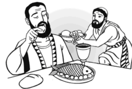
o neužitečných službách