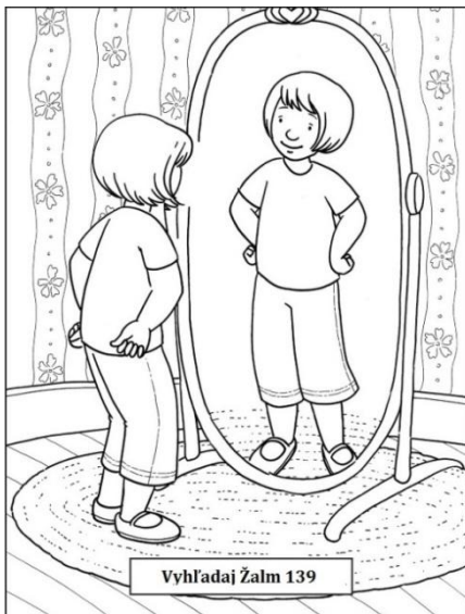
Vyhľadaj Žalm 139

Veď ty si stvoril moje útroby, utkal si ma v živote mojej matky. Chválim Ťa, že si ma utvoril tak