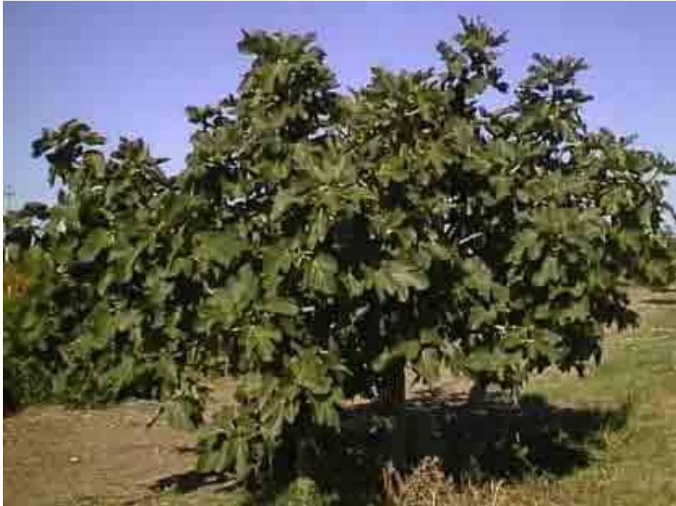
Príloha č. 2: Pianta del figo