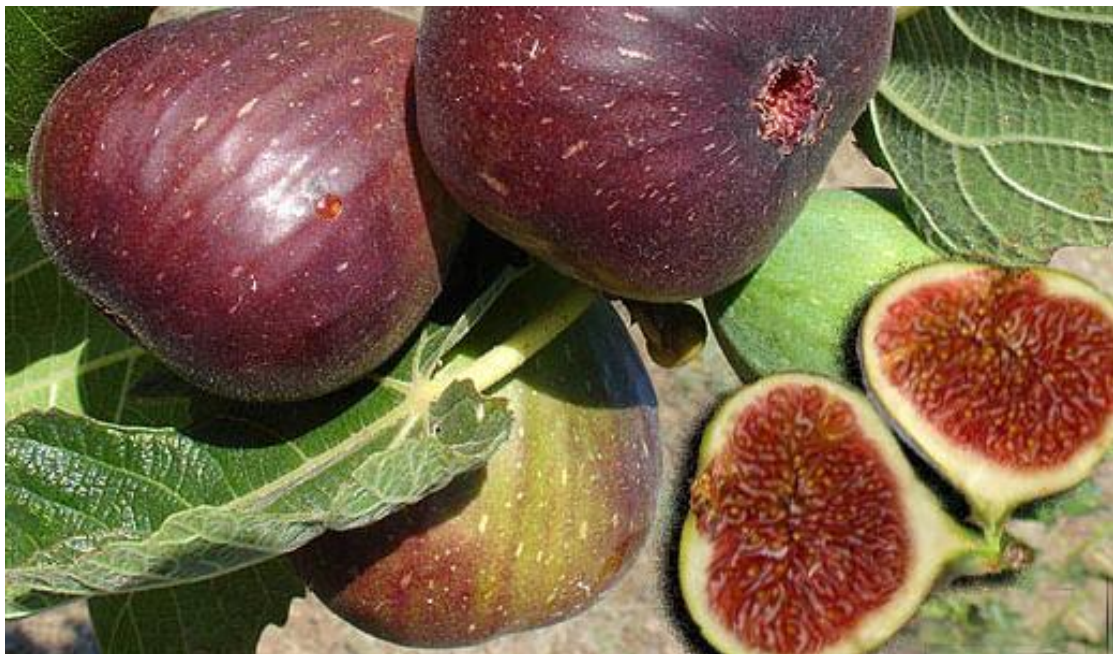
Príloha č. 3: Strom a ovocie figovníka