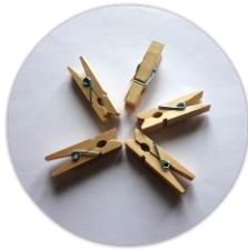
FOTO – natiahnite si niekde v obývačke špagát a každý si vezmite štipce. Premýšľajte zajtra nad niekým, koho si nosíte „prištipcovaného“ v srdci, kto sa „vešia“ do vašich modlitieb... Nájdite/vytlačte si jeho fotku, pripnite ju na špagát a večer sa za všetkých tých vašich drahých spoločne pomodlite.